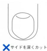
サイドを深くカット