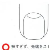
短すぎず、先端をストレートに。コーナーだけ少々角を整える